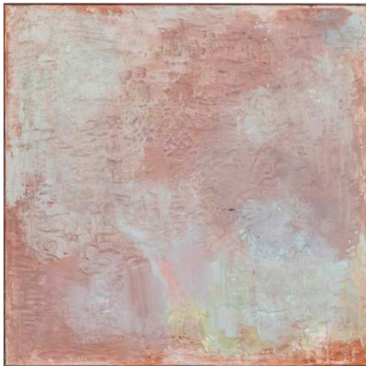
Thea Djordjadze , Untitled [Sans titre] , 2021, bois, plâtre, peinture, 130 x 130 x 3,5 cm, Photo: Ingo Kniest. Courtesy Sprüth Magers. © Thea Djordjadze / VG Bild-Kunst, Bonn

Téléchargez notre application MAMC+ gratuite sur Appstore et Playstore Billetterie en ligne www.mamc.saint-etienne.fr