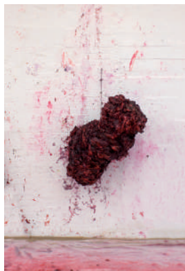
Hung , 2016.

La blessure apparaît initialement comme un interstice dans lequel nous pouvons nous glisser tel le ferait un voyeur, pour découvrir les mystères de l'intérieur du corps. Ensuite viennent des œuvres où la silicone est travaillée de telle manière que surgissent des concavités et des espaces dissimulés : la chair nue a des recoins, des secrets, et des épaisseurs. Ces œuvres interviennent dans la limite très subtile qui existe entre peinture et sculpture. Avec des œuvres comme Hung , la matière-chair se libère de la forme de la peinture.