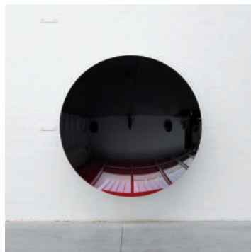
Mirror (Black to Red), 2016. Aluminium et peinture, 220 x 220 x 47 cm. © Anish Kapoor, 2017 / ADAGP, Paris, 2017.

Kapoor conçoit ses œuvres pour que l'espace qui les entoure soit aussi compris en tant qu'une de leurs composantes matérielles. Ainsi, par exemple, les miroirs concaves reflètent l'image inversée de ce qui leur fait face. Pour Kapoor « l'espace se renverse en lui-même » 3 . Le spectateur se retrouve tête bêche dans un reflet bouleversé de son environnement. L'artiste conçoit la relation entre œuvre, espace et spectateur comme primordiale : dans cet espace liminaire, les frontières fusionnent et l'incertitude s'impose.