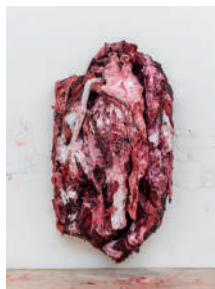
Unborn , 2015.

Kapoor se confronte à ce qu'il y a de plus inébranlable dans notre monde, gravité, infini, origine. Avec la gravité, il modèle des sculptures molles, s'affaissant – du moins en apparence – qui créent l'impression d'être un magma vivant en constante recomposition. Dans My Red Homeland , il dépeint un cycle de l'infini, terriblement lent, sans but ni origine. En intitulant certaines de ses œuvres en silicone Unborn (« Qui n'est pas encore né »), First Milk (« Premier lait »), Tongue Memory (« Mémoire de la langue »), Kapoor pose la question majeure de la quête de l'Origine ou de la genèse. Ces œuvres ont trait à nos souvenirs les plus anciens, les plus enfouis dans notre chair. À nos premières expériences, en lien avec la maternité, à l'origine universelle de l'humanité toute entière. Si ces thèmes donnent le vertige, c'est qu'ils ressortent du sublime.